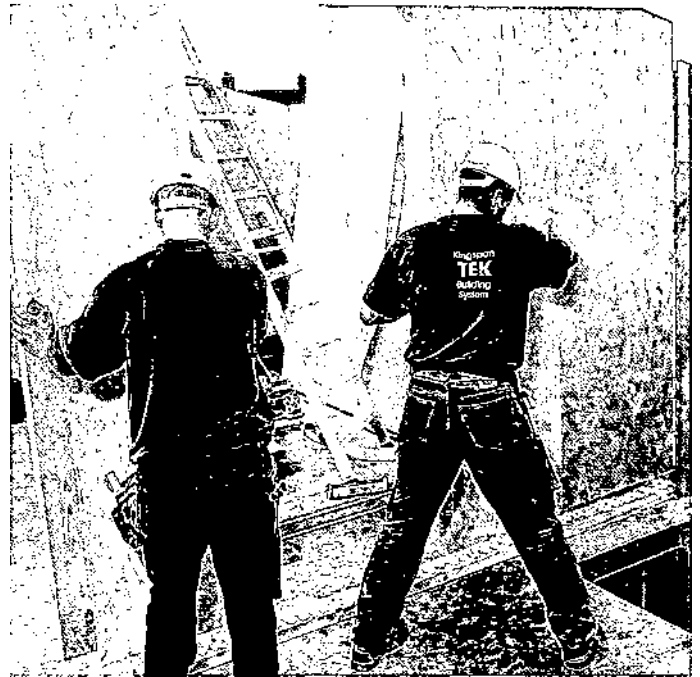
Montage einer Holzelementwand (Abb.6)