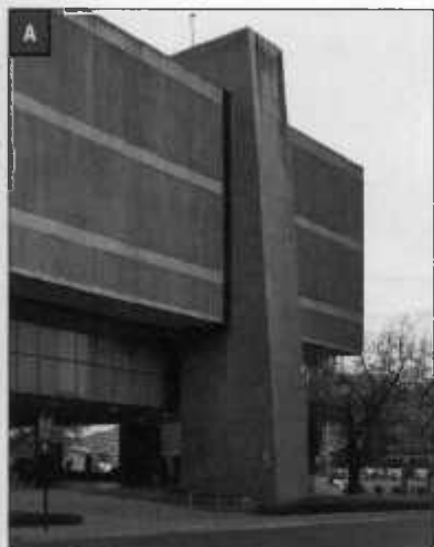
CENTRO ..... 20 El origen y una primera expansión City Centre: Origin and First Expansion