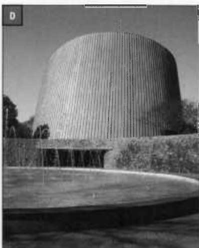
SAN PEDRO ..... 160 El nuevo centro de negocios y la expansión al sudoeste San Pedro: New Business Centre and Southwest Expansion