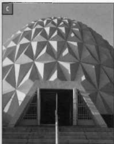
OBISPADO ..... 122 El Obispo y la expansión industrial al noroeste Obispo and Northwest Industrial Expansion