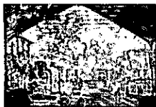
Claude Monet, Der Bahnhof Saint-Lazare