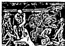
Auguste Rodin, Das Höllentor