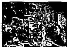
Gustave Courbet, Das Atelier des Künstlers