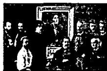
Henri Fantin-Latour, Hommage à Delacroix