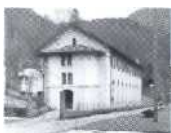
S. 18 Plan de l'eau, Neuenburg 1896, Electricite Neuchäteloise SA IENSA)