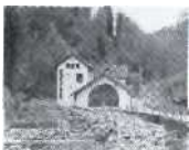
S.21 Sublin, Waadt 1898, Societe des Forces Motrices de l'Avancon (FMA)