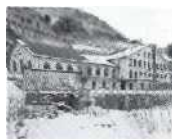
S.37 LesFarettes, Waadt 1906, Romande Energie