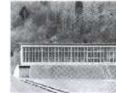
S 109 Lostalio, Graubunden 1958, Elettricit  Industriale SA ( ELIN )