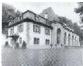
S. 62 LeChanet, Neuenburg 1914, Electricite Neuchâteloise SA (ENSA)