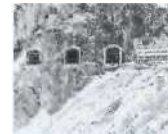
S. 113 Fionnay-Dixence, Wallis 1957, Grande Dixence SA