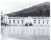
S.23 Ruppoldingen, Solothurn 1896, abgebrochen