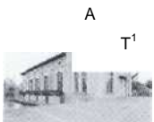
A T 1 S.26-27 Hagneck, Bern 1900, Bielersee Kraftwerke AG ( BIK )