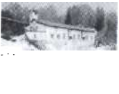
S.33 Ponte Brolla. Tessin 1904, Società Elettrica Soprocenerina SA ( SES )