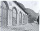
S.90 91 Piottino, Tessin 1932, Azienda Elettrica Ticinese ( AET )