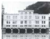
S.39 Felsenau, Bern 1909, Energie Wasser Bern (EWB)