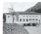
S. 115 Charmey, Freiburg 1957, Gruyere Energie SA