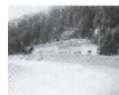
S. 117 Mottec, Wallis 1958, Forces Motrices de la Gougtra SA (FMG)