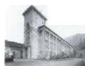
3.77 Amsteg, Uri 1924, SBB S. 78-79 Wägital-Siebnen, Schwyz 1924, AG Kraftwerk Wägital (AKW)