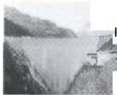
S. 132 133 Vogorno-Gordola, Tessin 1965, Verzasca SA