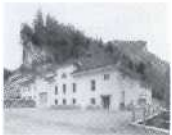
La Peuffeyre, Waadt 1927, Romande Energie