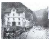
S.25 Combe-Garot, Neuenburg 1897, Service de l'electricite de la Ville de Neuchätel (SEN)