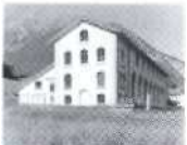
Sembrancher, Wallis 1929, Romande Energie