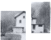
S.32 Niederurnen, Glarus 1903, Wasser- und EW der Gemeinde Niederurnen