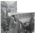
S. 125 Bärenburg, Graubünden 1963, Kraftwerke Hinterrhein AG (KHR)