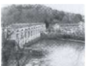
S.66 Muhleberg, Bern 1921, BKW FMB Energie AG