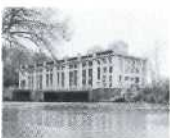
S. 52-53 Kallnach, Bern 1913, BKW FMB Energie AG