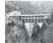
S. 145 Mapragg, St. Gallen 1977, Kraftwerke Sarganserland AG (KSL)