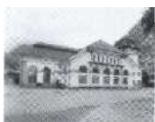
S.41 Ackersand, Wallis 1909, KW Ackersand I AG