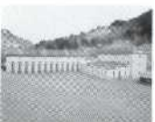
S. 69 Kublis, Graubünden 1921, Rätia Energie Klosters AG (HE)