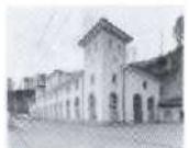
S.29 Hauterive, Freiburg 1902, Entreprises Electriques Fribourgeoises (EEF)