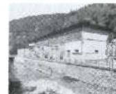
S. 114 Vissoie, Wallis 1958, Forces Motrices de la Gougtra SA (FMG)