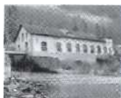
S. 11 Maigrauge, Freiburg 1890, stillgelegt