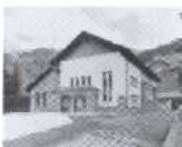
S. 106 Les Diablerets, Waadt 1957, Romande nergie