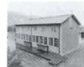
S. 110 Rothcnbrunnen, Graub nden 1958, EW der Stadt Z rich (cwz)