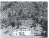
S. 93 Champsec, Wallis 1930, Forces Motrices de Mauvoisin SA (FMM)