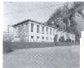
S. 100 Lavey, Waadt 1950, Service de l'Electricite Lausanne (SEL)