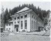
S. 56-57 Lünen, Graubünden 1914, Gemeindekorporation Kraftwerk Lünen (GKL)